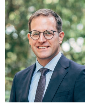
Simon Schall Gesundheitsdezernent